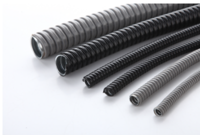
MCR型金属软管 Metal Flexible Conduit