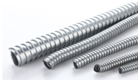
MC型金属软管 Metal Flexible Conduit